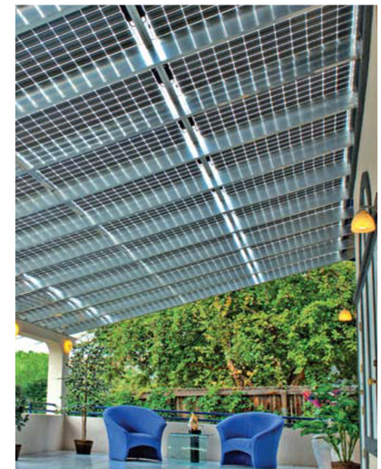
ประยุกต์ใช้กับอาคาร